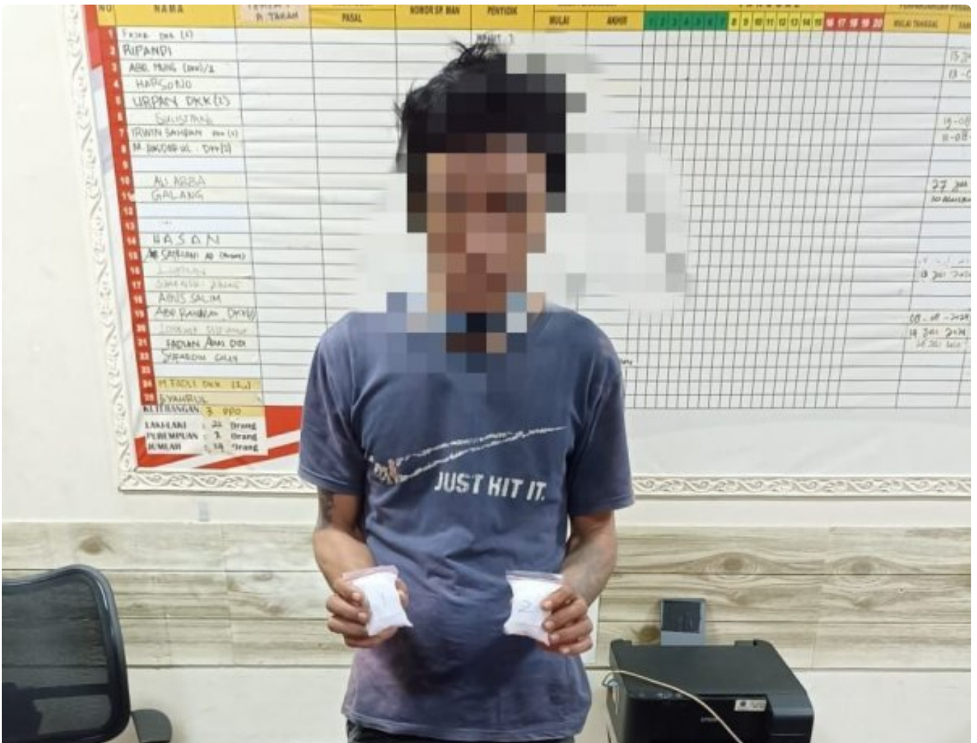
Polres Morowali amankan Pelaku Narkotika dari Bahodopi