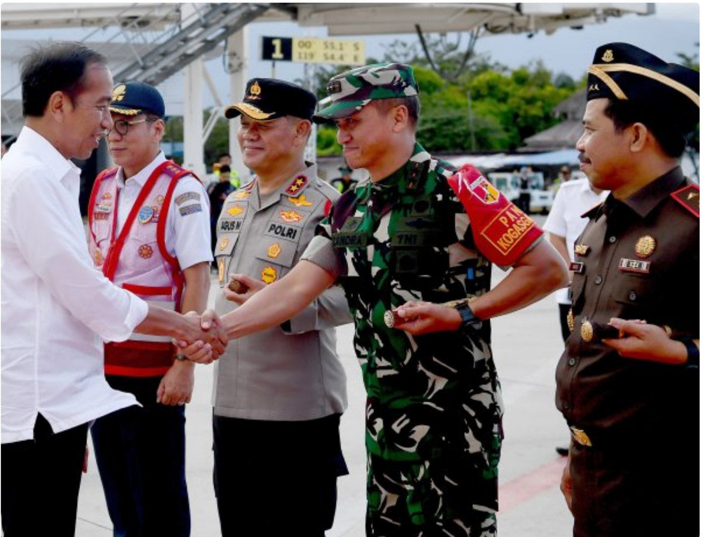
Presiden Jokowi saat hendak bertolak ke Jakarta