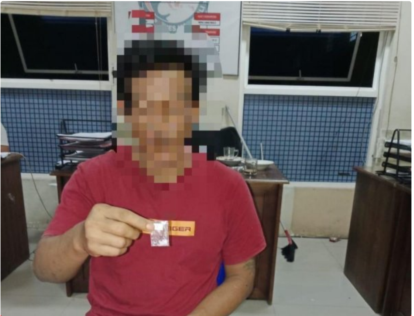
Pelaku terlibat Sabu terancam penjara seumur hidup

Morowali, 15 Januari 2025 – Polres Morowali berhasil mengungkap