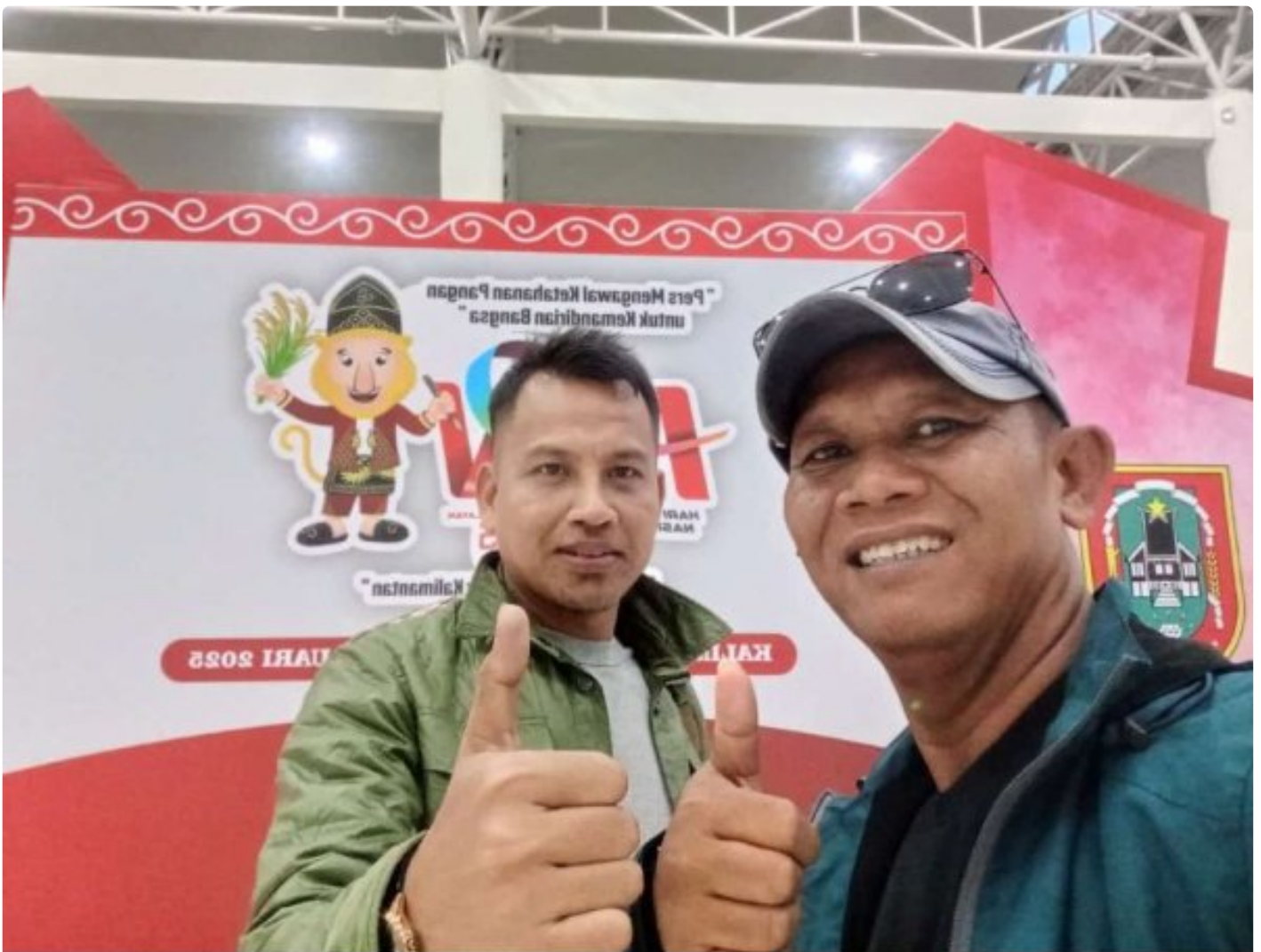
Sekretaris dan Bendahara PWI Kabupaten Morowali

MOROWALI, Sulawesi Tengah- Pengurus Persatuan Wartawan Indonesia (PWI) Kabupaten Morowali, Sulawesi Tengah menyatakan siap mengikuti puncak peringatan Hari Pers Nasional (HPN) di Banjarmasin, Kalimantan Selatan.